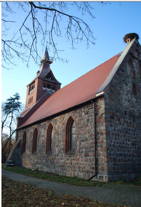
Wolczkowo Kościół p.w. Matki Boskiej Szkaplerznej nr rej.151