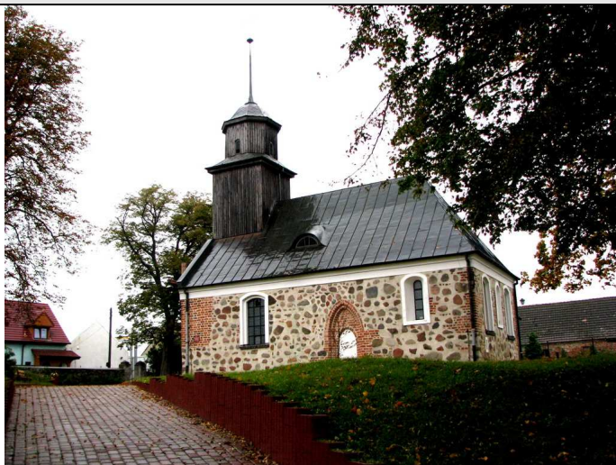
Wąwelnica Kościół p.w. Matki Boskiej Częstochowskiej nr rej. 548